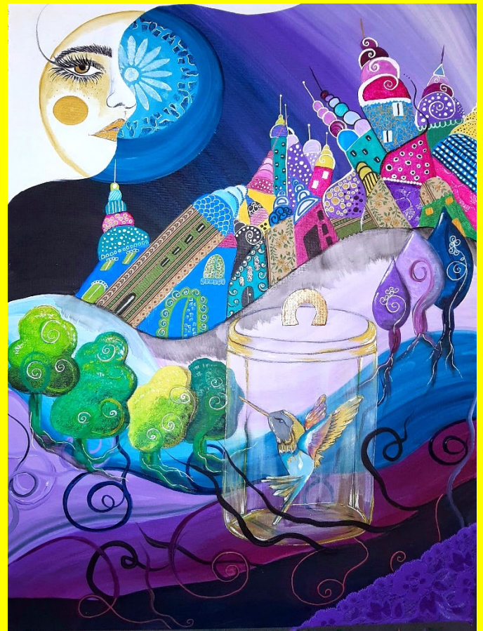
Silvia Guglielmi, Prigioniera di un sogno , penne gel, stoffe e pizzi su cartone telato, cm 50x70